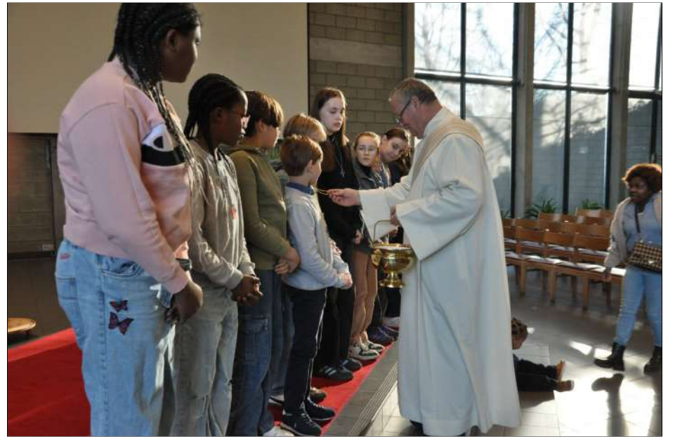
Het zegenen van de kruisjes