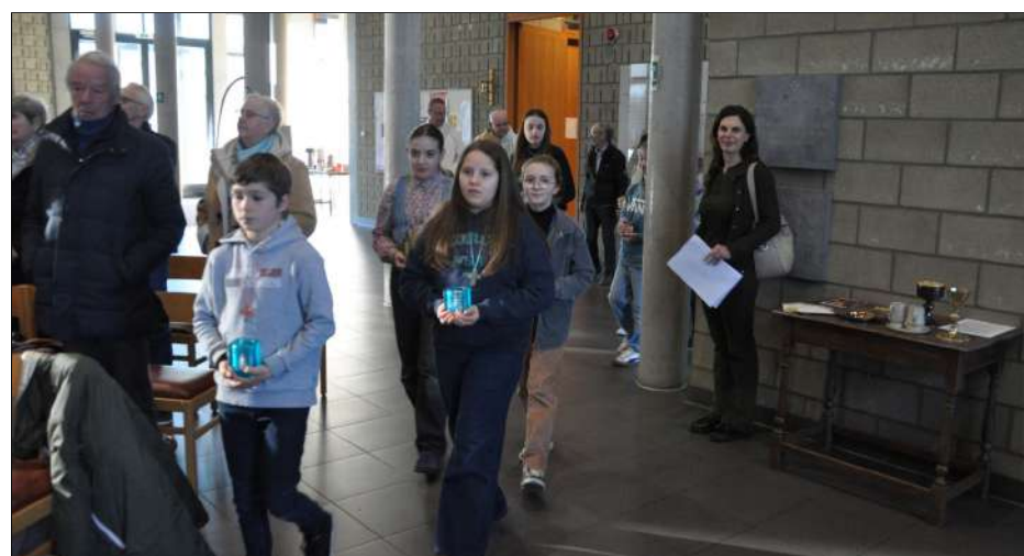
Kandidaat vormelingen brengen het licht aan