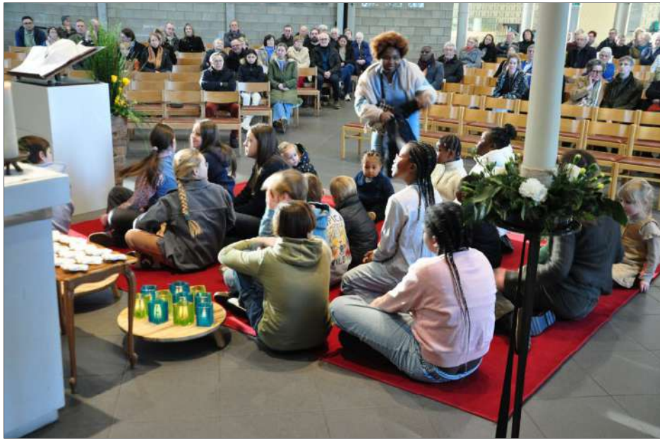
Samen luisteren we naar het evangelie