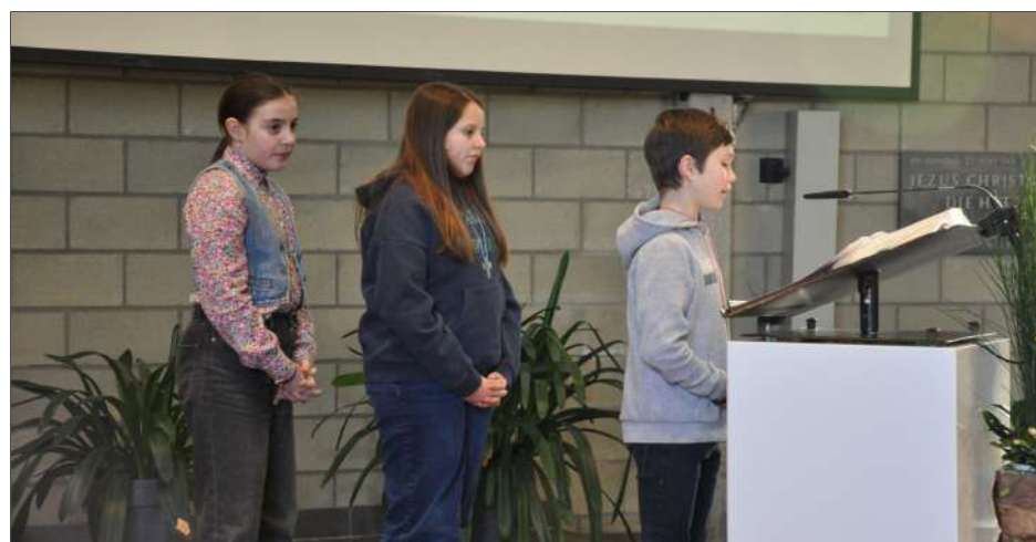
Kandidaat vormelingen brengen de schuldbeden