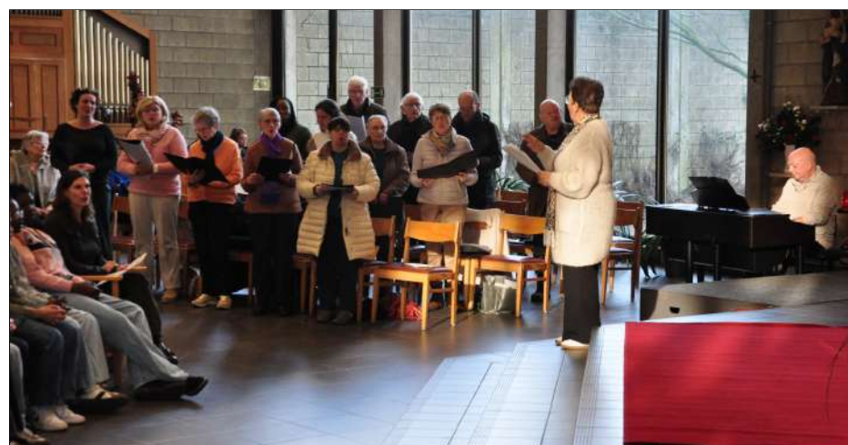
Het dames- en herenkoor in actie