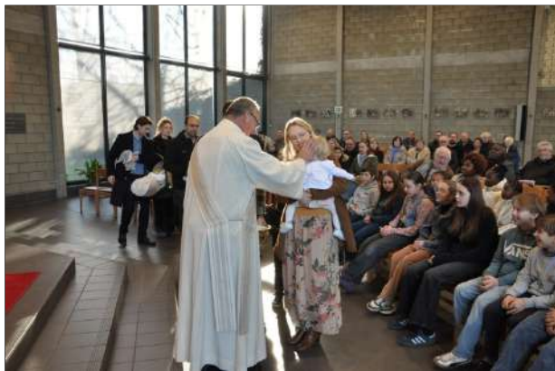
Het zegenen van de nieuw gedoopte kindjes