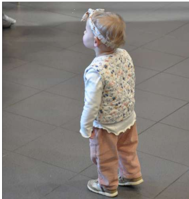
Een aandachtige aanwezig