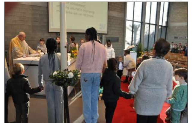
Samen het Onze Vader bidden