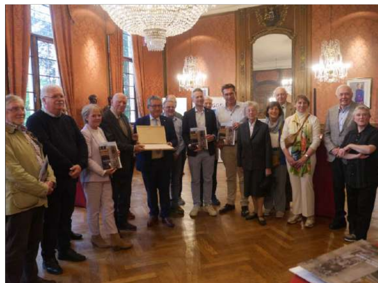
Naar aanleiding van het gouden jubileum van de vereniging werden de leden van de vzw op het Brugse stadhuis ontvangen.