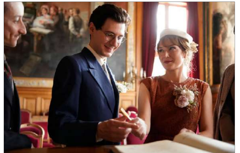
Le temps d'aimer

"Een ontroerende en persoonlijke film over twee geliefden, die elkaar proberen te genezen." Le Monde