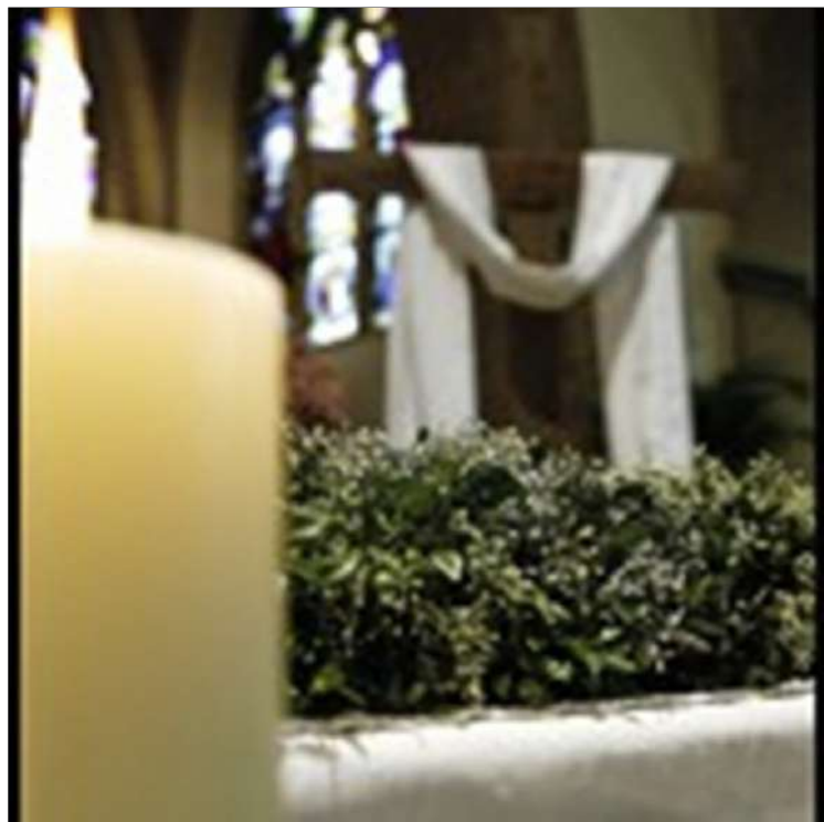
Het witte doek over het kruis als teken van de verrijzenis.

De periode rond Pasen maakt vele mensen blij, zij het dan om verschillende redenen.