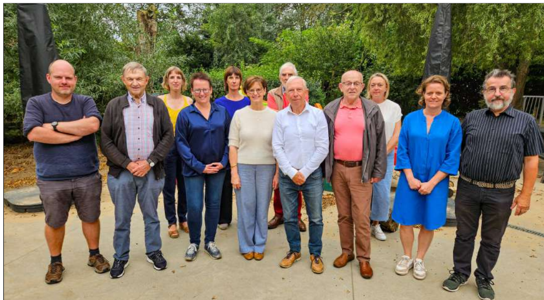
Alle betrokkenen bij dit project.