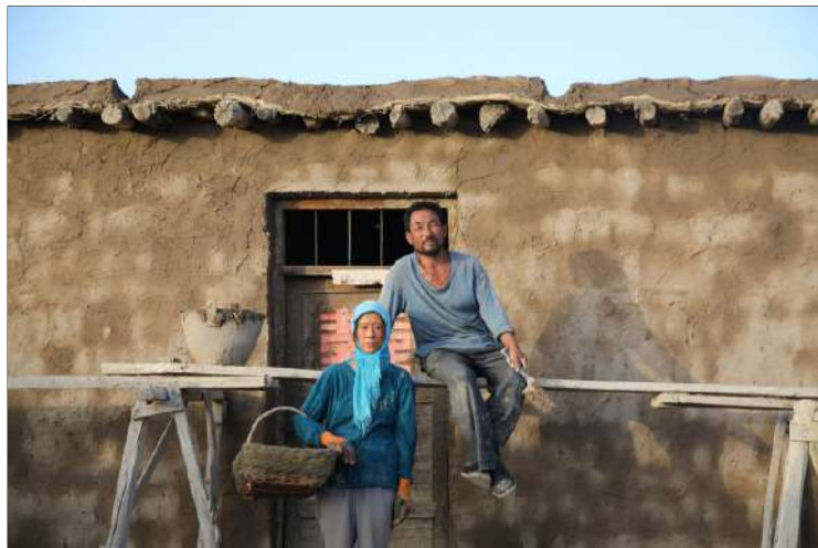
Return to dust

China 2022 - Regie Ruijun Li - Taal: Chinees - 133' Vertolking: Renlin Wu, Qing Hai