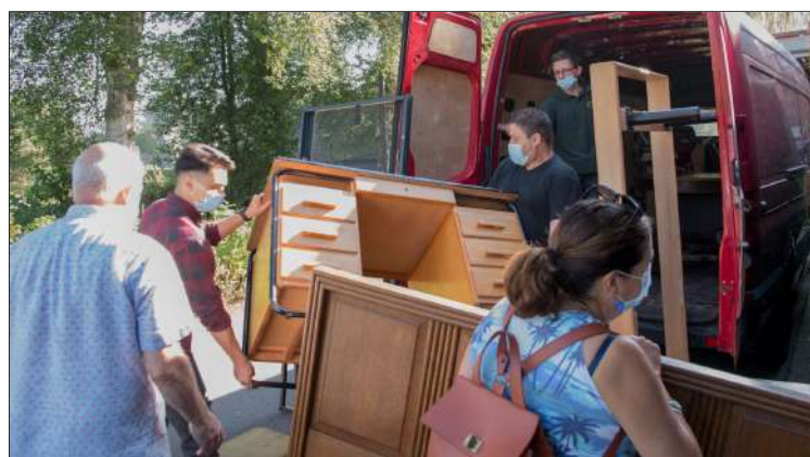
Vrijwilligers verhuizen meubilair