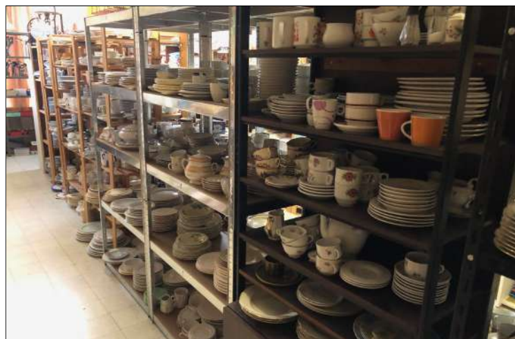
Huusraad voor wie die nodig heeft

(vervolg van dit artikel: zie volgende week)