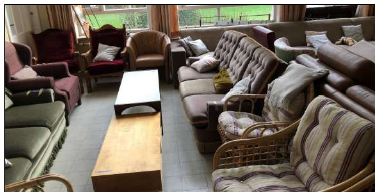
Zitmeubilair staat tentoon in 'tMussennest