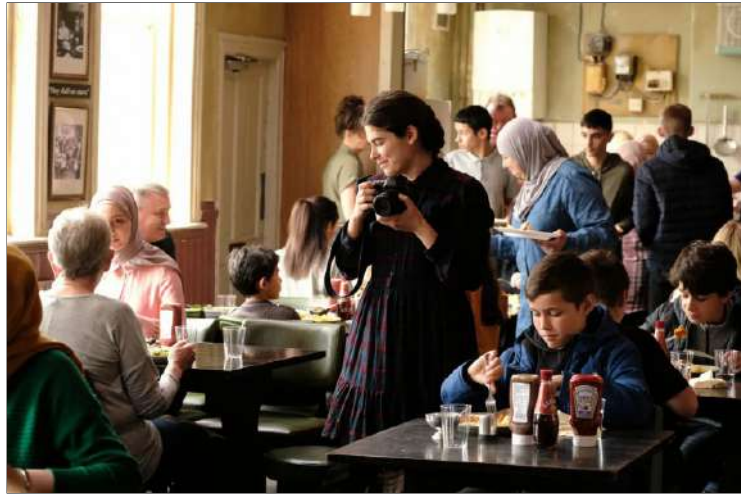
The old oak

KINEPOLIS BEREIKBAAR MET OPENBAAR VERVOER DE LIJN HEEN: Station Brugge lijn 2 (Kinopolis-Station-Centrum-Coiseaukaai) Perron 1 B Vertrek: 19.23 u. - Aankomst 19.35 u. TERUG: