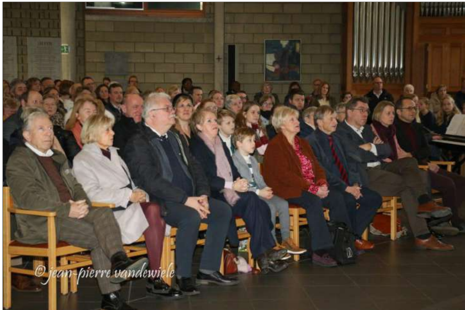
Heel wat mensen namen deel aan deze herdenkingsviering.