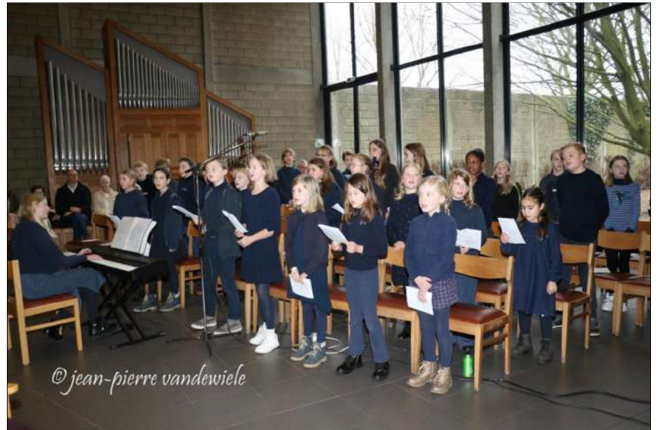
Het muziekatelier van Kantelberg luisterde de viering op.