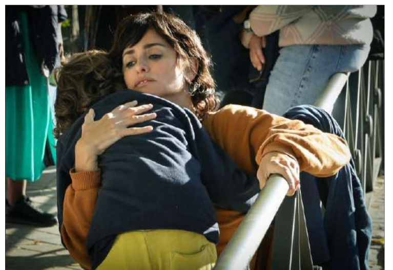
En los margenes

"De film exploreert de impact van recessie op de relaties tussen koppels, op ouderen en kinderen." Filmfestival voor de Spaanse Film Amsterdam