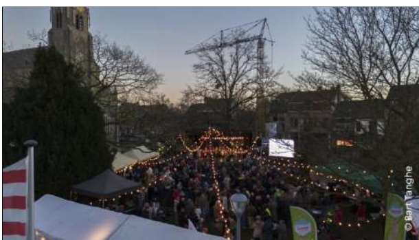
Het kerkplein was mooi verlicht.