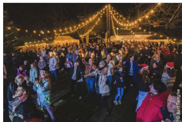
Veel volk op het kerkplein.