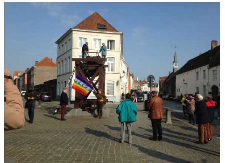
Voetluiden voor vrede

12 november om 16.30 uur in de kapel van de zusters Maricolen, Oude Zak 34, Brugge.