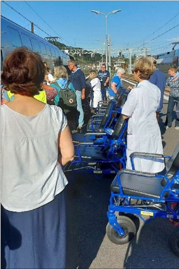
Rolstoelen op een rij..