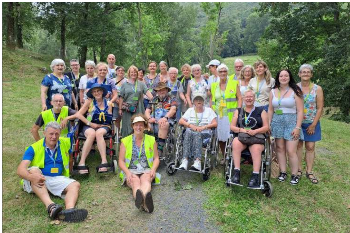
groepsfoto van mensen in de Welzijnsschakels van het bisdom Brugge.

Van 14 tot en met 20 juli kregen de mensen van de welzijnsschakel Kantel de mogelijkheid om met de organisatie van het bisdom Brugge mee te gaan naar Lourdes .