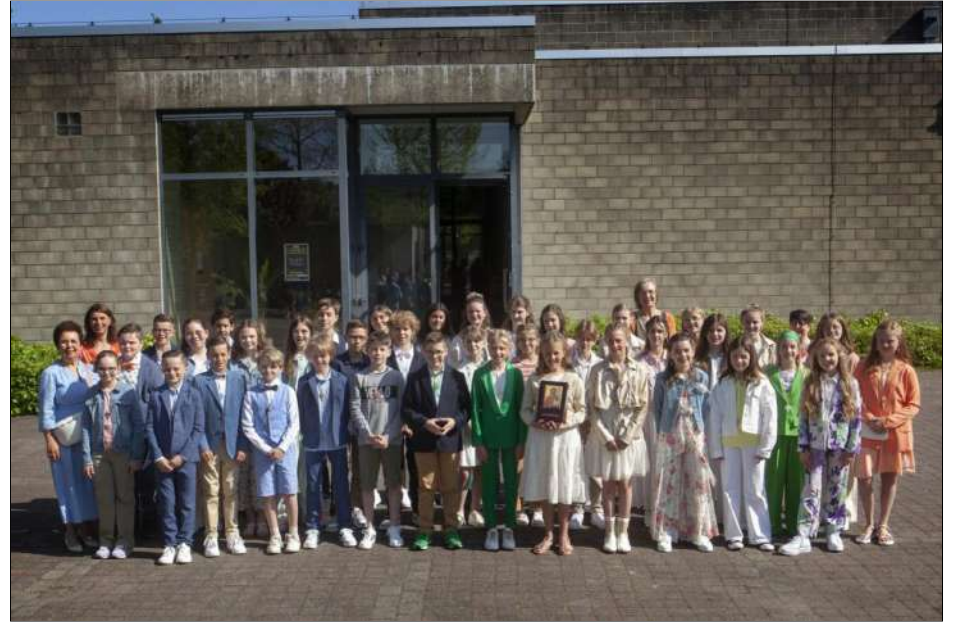
Vormelingen van de pastorale eenheid Marta en Maria Sint-Kruis.