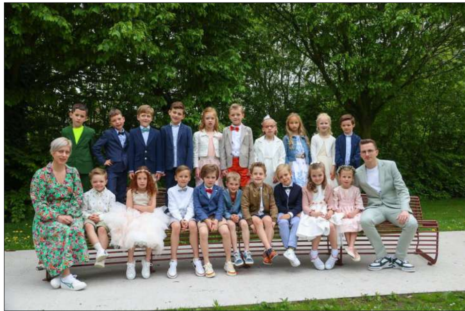
Eerste communicanten VBS Kantelberg