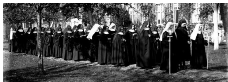
Uit de geschiedenis van de abdij: processie met de Zusters

Op zaterdag 8 juli organiseert Toerisme Vlaanderen samen met Westtoer, VisitBruges en andere partners een historische belevingstocht van de Sint-Godelieveabdij (Abdij Ten Putte) in Gistel naar de Sint-Godelieveabdij in Brugge.