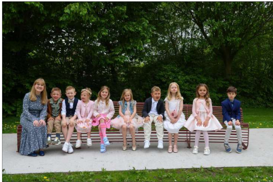
Eerste communicanten Go!Context