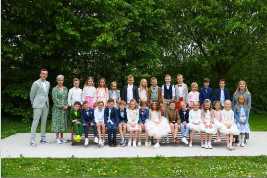
Groepsfoto viering 7 mei in Sint-Thomas (VBS Kantelberg en GO!Context)