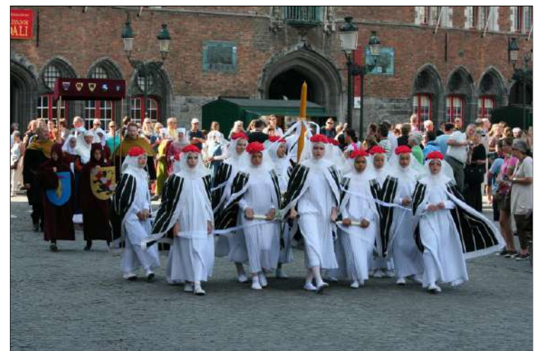
Brugse Belofte

Jaarlijks volbrengt de Brugse bevolking op 15 augustus een eeuwenoude belofte .