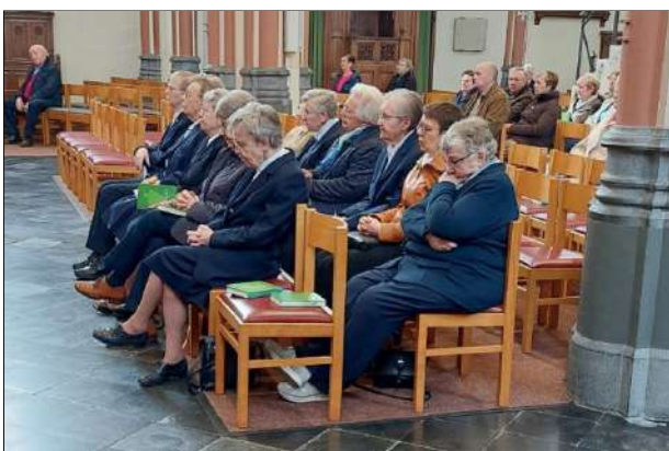
...de viering was immers ter ere van hen.