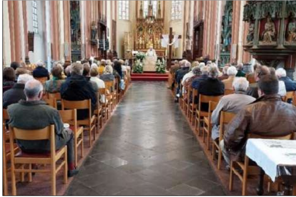
Het was een sfeervolle viering en er werd nog lang nagepraat tijdens de receptie.