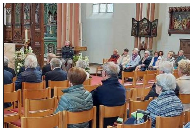
Sympathisanten van de zusters zijn ingegaan op de uitnodiging om naar de viering te komen.