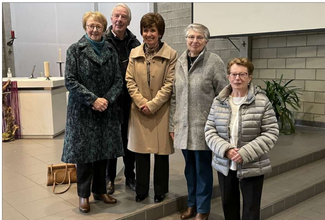
Bestuur en winnaars van een beurs van de Vrienden van Lourdes.

Op zondag 5 maart had in de kerk van Sint-Thomas de trekking plaats van de beurzen van de Vrienden van Lourdes. Proficiat aan de winnaars.