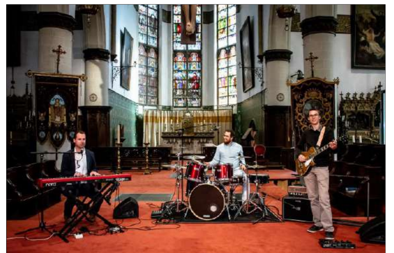
Muziekband Xamen