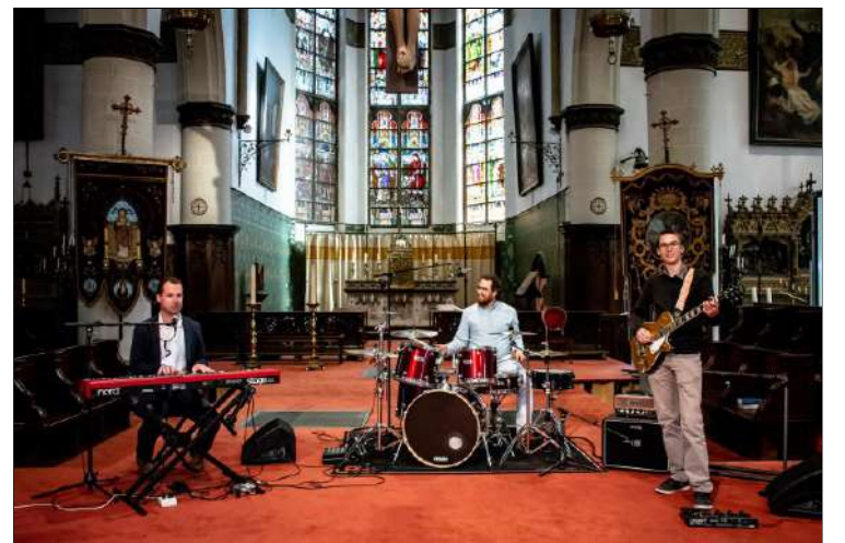
Muziekband Xamen