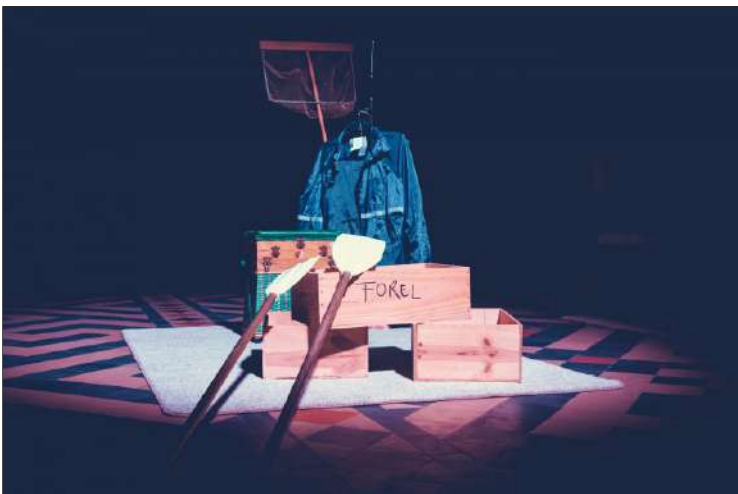
'De personages zijn tijdens de voorstelling niet aanwezig'

Woensdag 29 maart Sint-Jacobskerk Brugge Deuren open vanaf 19.00 uur - Start voorstelling omstreeks 19.30 uur.