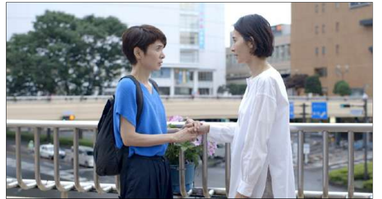
Wheel of fortune and fantasy

In het eerste deel volgen we een model dat een ontdekking doet over haar ex,