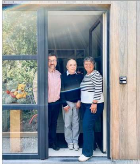
De gezamenlijke ingang.