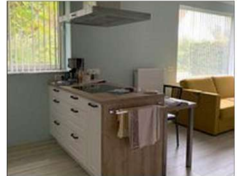
Het keukentje van Filip.