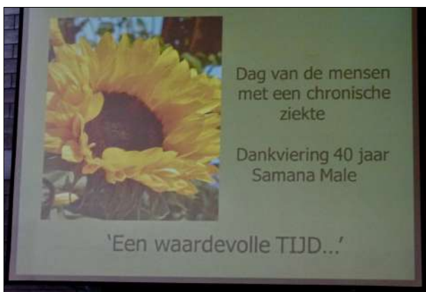
Startdia van de viering.