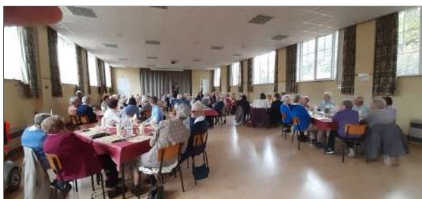
Iedereen luistert aandachtig.