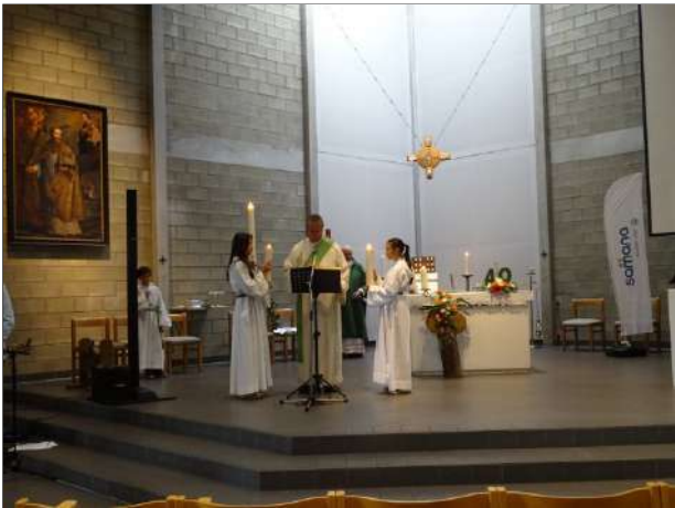
Sfeerbeeld van de viering.