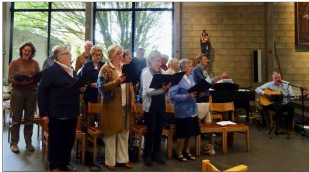
Het Dames- en heren koor luisterde de viering op.