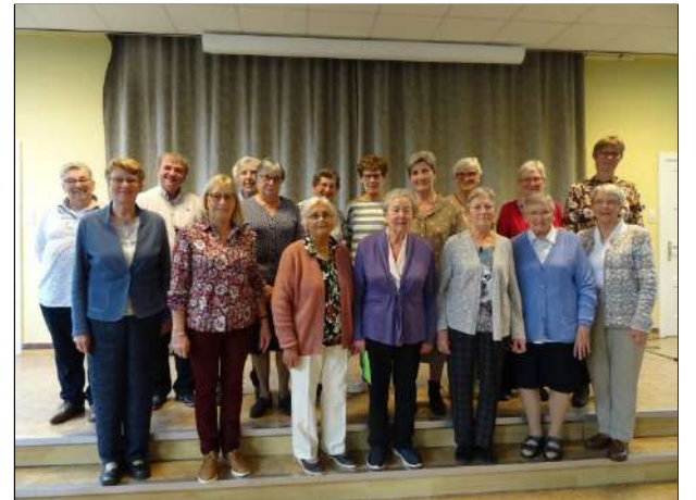
Het huidige bestuur, samen met enkele oud-bestuursleden samen op de foto.