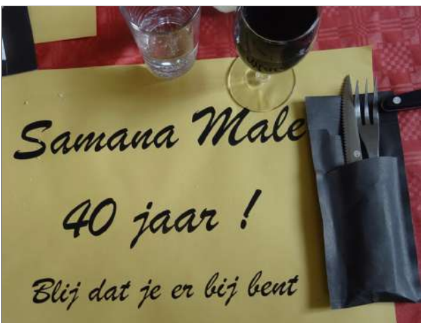
Iedereen was hartelijk welkom.