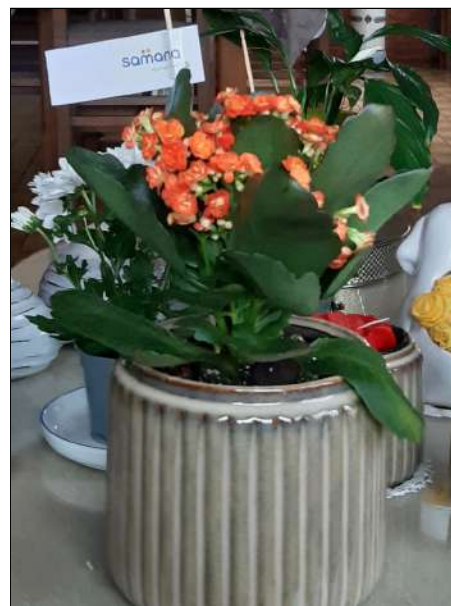
Bij een feest hoort een bloemetje.