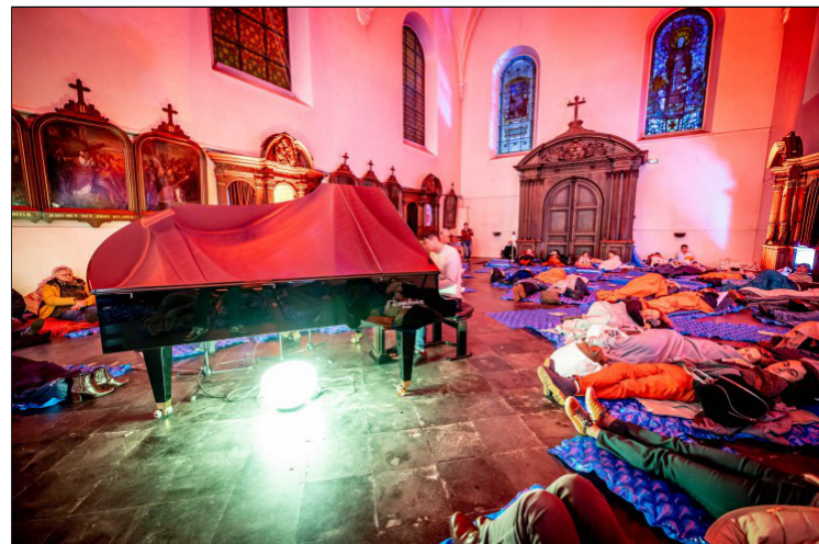
Uniek ligconcert

Met je eigen matje, onder je deken of in je slaapzak: gedurende een uur geniet je van een intiem ligconcert in het voormalige woonzorgcentrum Jeruzalem. De muziek wordt gespeeld op een akoestische piano in de stemmige kapel. Muziek verbindt mensen, mensen hier maar ook mensen in je gedachten.