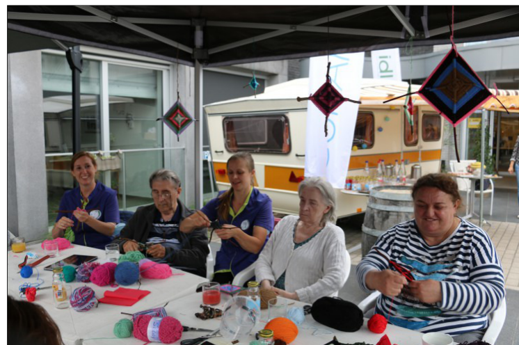
Bezige bijen in de workshop

Wees erbij op het unieke ligconcert: zondag 25 september, van 8.00 tot 9.00 uur, in het voormalige WZC Jeruzalem, ingang via de poort in de Rolweg, naast huisnummer 44.