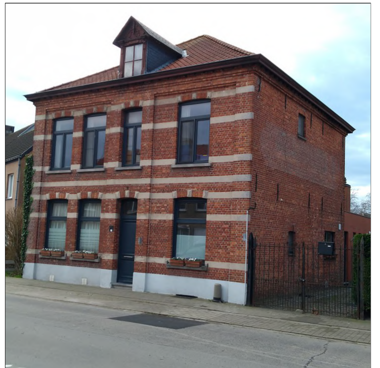
Molenaarshuis in de Schaakstraat van 1905

Lodewijk van Male is in het kasteel van Male geboren in 1330. Hij overleed in 1384 als laatste autonome graaf van Vlaanderen. Lodewijk legde o.a. de eerste steen van het Brugse Stadhuis. Munten geslagen in opdracht van Lodewijk zullen heel gedetailleerd te zien zijn in de expositie. De weg van Maleveld naar het gehucht Male is naar hem genoemd. Die weg loopt